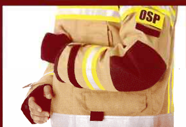
wzmocnienie na łokciach i kolanach w postaci wkładu amortyzującego nacisk