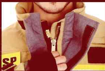
zamek typu anti-panic