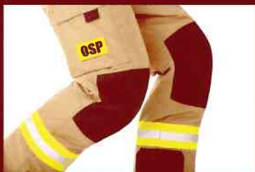
wzmocnienia na kolanach i łokciach, krawędziach rękawów i spodni z Kevlaru®